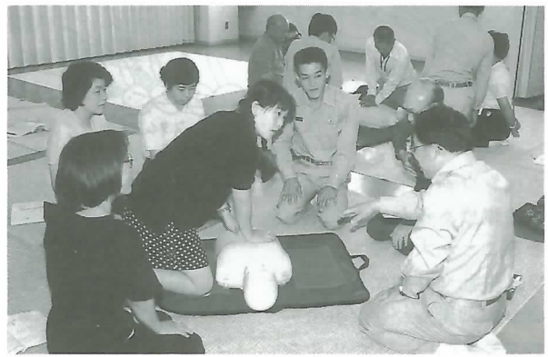
▶熱心に訓練する参加者

参加者は、消防署員から応急手当ての重要性などを聞いた後、3グループに分かれて実際に救命法を訓練しました。