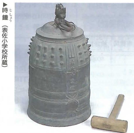
▶時鐘 (表佐小学校所蔵)

学校に時計が備えつけられる前、学校生活は日ざしや教師の腹時計でおおよその区切りがつけられていました。