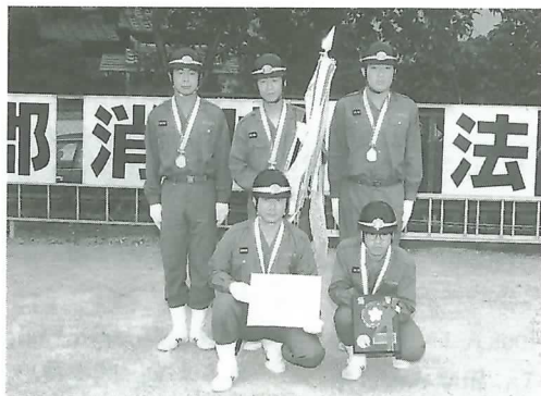
▲自動車ポンプの部優勝の東分団の選手