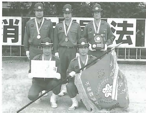
▼小型動力ポンプの部優勝の東分団の選手