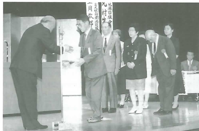
◀福祉事業に功績のあった人に表彰状が贈られる

第12回町社会福祉大会（町社会福祉協議会主催）が7月1日、文化会館で開かれ、約700人が参加しました。