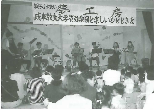
▲楽団の演奏に聴き入る園児ら

レクリエーションの部では、手遊びやリズム体操を行い、園児は大喜び。親子のふれあいを深めました。