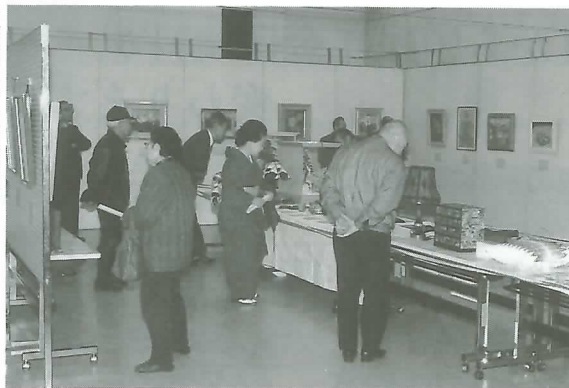
▶作品に見入る観覧者