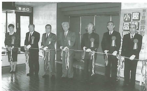
▲関係者によるテープカット