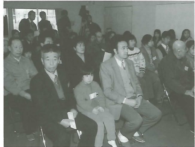
◀第2期の入所者の人たち

厚生省が設けた岐阜中国帰国者定着促進センター(府中)で2月9日、第2期生の入所式が行われました。