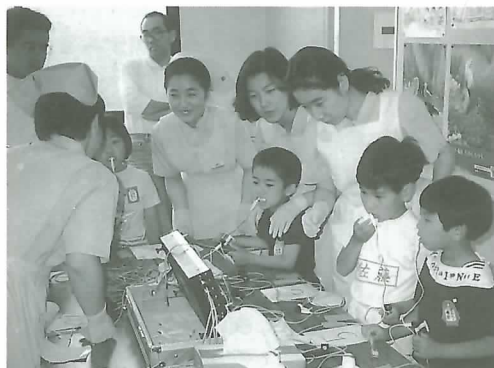
▲フッ素塗布を受ける子どもたち

「歯の衛生週間」が始まった6月4日、歯の健康フェスティバルが保健センターで開かれました。