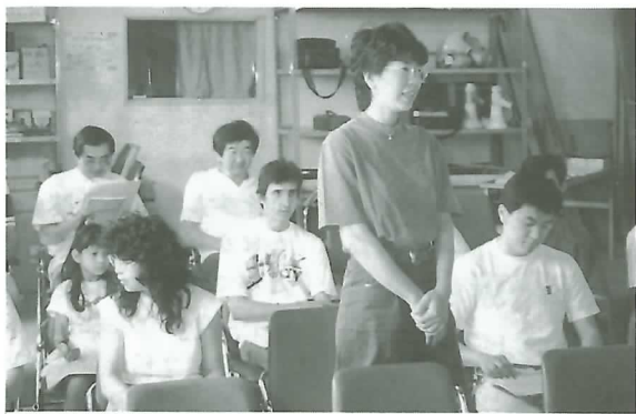
▲自己紹介する講座参加者