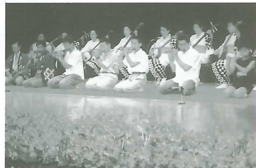
▲祭ばやしを披露する保存会の皆さん

また会場には茶席が設けられたほか、書道や絵画、パッチワーク、保育園児や小1・2年生らの絵画などを展示。地区民全員による手づくりの文化祭となり、会場は1日中にぎわいました。