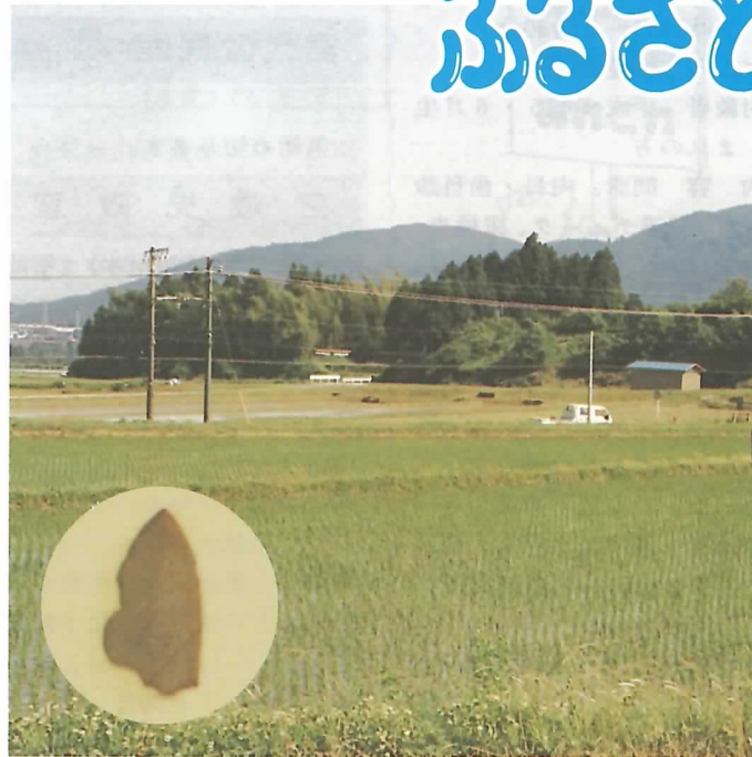
▲ 磨製石鏃(ませいせきぞく)と長尾遺跡遠景

広報たるい6月15日号/No.451 平成6年6月15日発行 発行/岐阜県不破郡垂井町役場 編集/総務課 印刷/日之出印刷