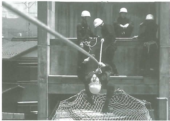
◀チロリアン渡りに取り組む署員

ロープ結索、水平に張られたロープ(長さ約20m)のモンキー渡りなど7種目で、スピード、安全性、正確さを競いました。