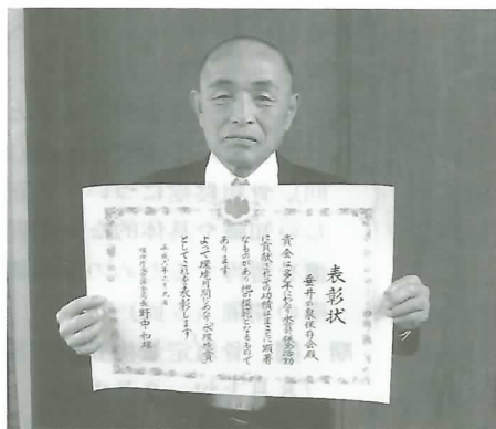
◀ 表彰状を手にする市川会長