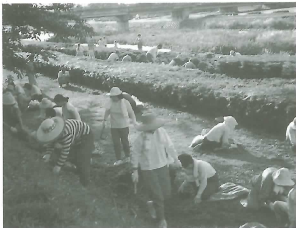
▲ 汗だくになって作業する参加者

みんなが使う公園です。空き缶のポイ捨てなど無責任な行動をしないようにして、いつもきれいな公園にしたいものです。