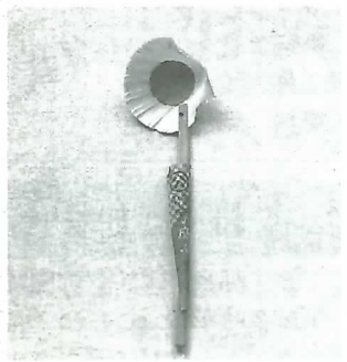
▲貝を利用したしゃもじ

戦争の記憶を伝え平和の大切さを考えると同時に、現代の豊かすぎる暮らしを見直してみてもどうでしょうか。