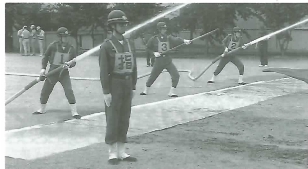
◀ 的確な操法技術を競う消防団員