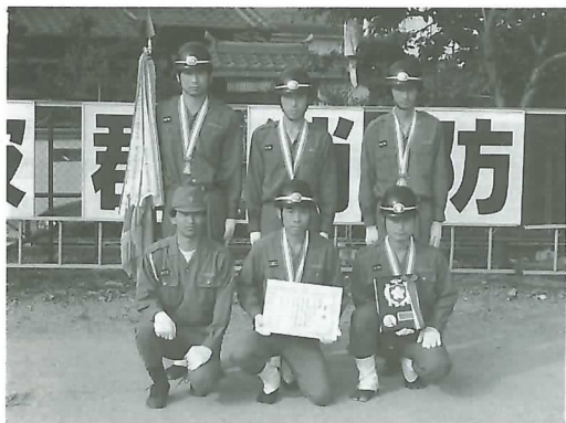
▲ 小型動力ポンプの部優勝の東分団第1班の選手