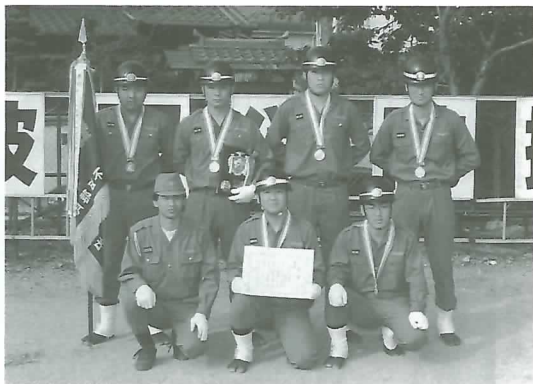
▼ 自動車ポンプの部優勝の東分団の選手