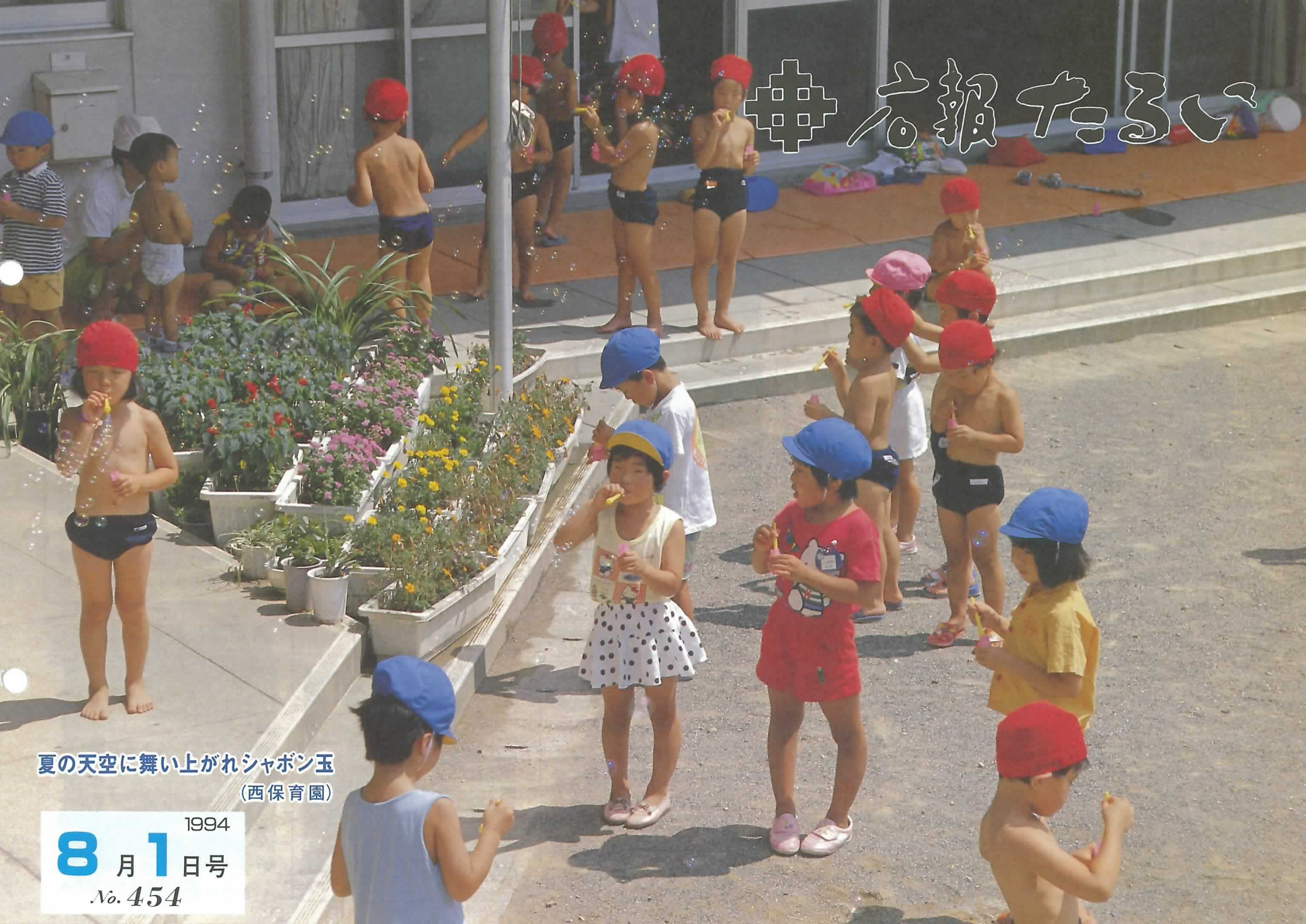
夏の天空に舞い上がれシャボン玉 (西保育園)