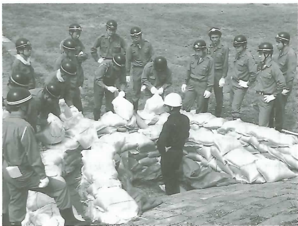
▲訓練に汗を流す消防団員

り、堤防から漏れ出した水をせき止める「月の輪工法」や堤防の表面を守る「シート張り工法」など、7工法に取り組みました。