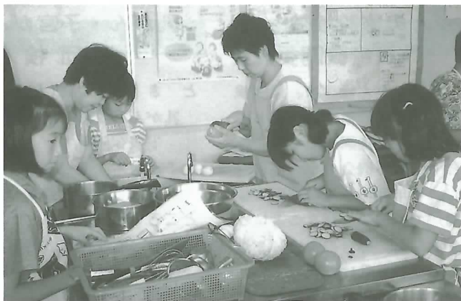
▶和気あいあいと調理をする子どもら

そして、調理した4品を食 べながら、和気あいあいと親 子のふれあいを深めました。