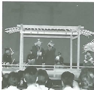
▲南宮大社の神事芸能