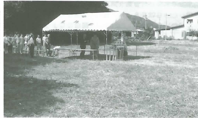
▶発掘作業の安全を祈る