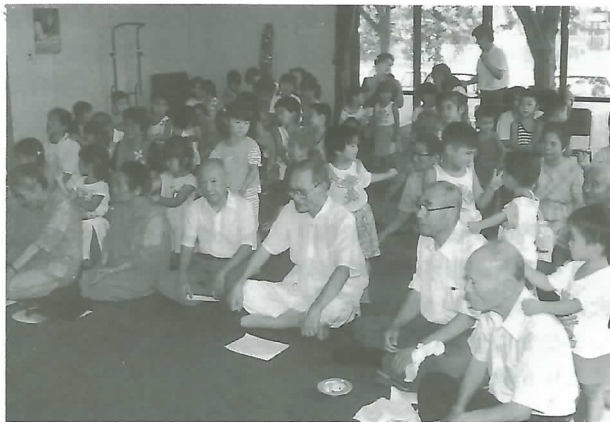
▲園児から肩たたきのサービスを受けるお年寄り

つばき会のメンバーが作った昼食を食べた後は、不破高校生との座談会が行われ、お年寄りは楽しいひと時を過ごしました。