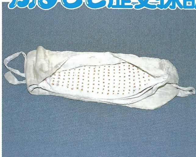
▲ 千人針 (企画展「戦時下の暮らし」で展示中)