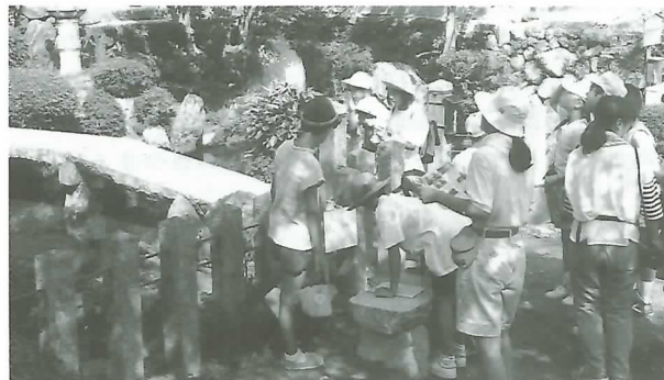
▲ 垂井の泉での問題を考える参加者