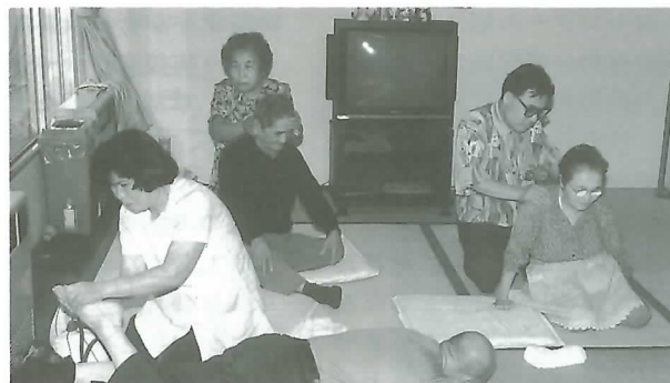
▲ マッサージ奉仕をする協会員