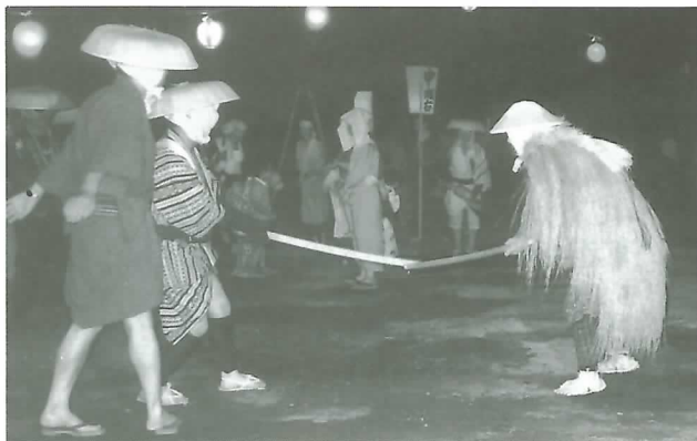
▲ ユーモラスな踊りを披露する参加者

同公民館では、今後も特色ある公民館活動として栗原おどりを伝承していく計画で、地区のふれあいの場としてますます盛んになることが期待されます。