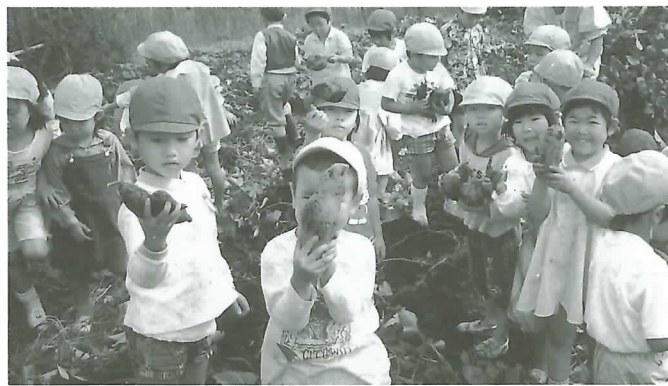
◀掘り出した芋を手に大喜びの園児

大小約150個の収穫があり、収穫した芋は、早速園児のおやつとして、ふかし芋にして試食。園児は「おいしいね」と大喜びでした。