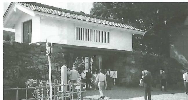
◀ 竹中氏陣屋跡を視察し記念撮影などをする一行