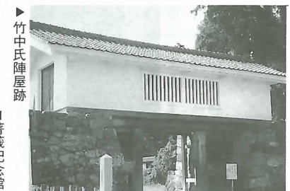
▶竹中氏陣屋跡 ◀善莪記念館