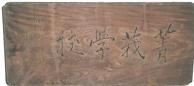
▲企画展「明治近代国家の推進者 神田孝平」で展示中