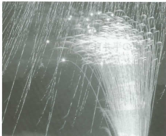
◀エンディング花火ショー(6日・4時20分)