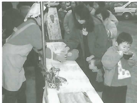
◀ 温かいおかゆをどうぞ

町食生活改善協議会は1月7日、南宮大社駐車場で七草がゆを参拝客らに振る舞いました。同協議会のメンバーら約20人が1,000食分を用意。