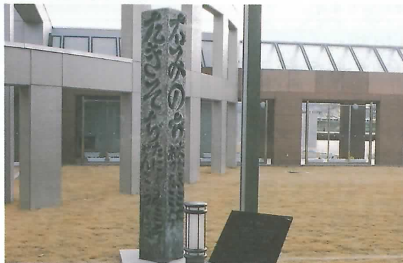
▲タリピアセンター屋外展示「追分の道標」(複製)

中山道と美濃路の追分には、享保3年(1718年)に建てられた高さ2.7mもある大きな道標がありました。