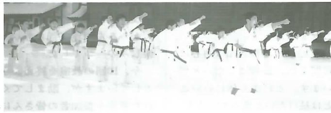
気合満点の げいこ▶

本動作の練習を1時間ほど行いました。ピンと冷たく張り詰めた空気の中、「エイッ」と元気な掛け声が響き、境内には団員の気合がみなぎりました。その後、朝倉町民体育館で