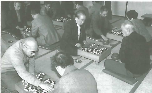
▲ 熱戦を繰り広げる参加者

参加者は日ごろの力を発揮しようと、楽しみながらも真剣そのもの。会場には碁を打つ音が響き渡りました。