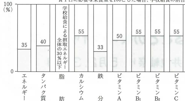
☆1日に必要な栄養量を100とした場合、学校給食の割合。