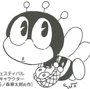
生涯学習フェスティバル マスコットキャラクター マナビイ(石ノ森章太郎氏作)