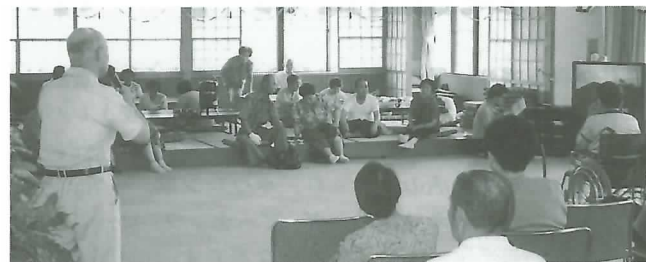
◀ カラオケを楽しむ参加者ら