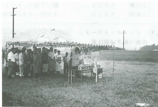
▲ 発掘作業の安全を祈る関係者ら

この日は調査に先立ち、関係者らが出席して作業の安全を祈る神事などをしました。作業は9月上旬までの予定で行われます。