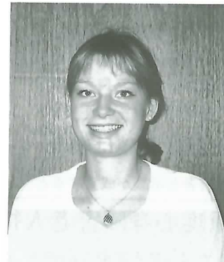
◀ キャロラインさん

日本の印象については、イギリスにいるときは「高層ビルが建ち並び、とても忙しそうな国」だったそうですが、実際に住んでみると「とても親しみやすい国」だそうです。