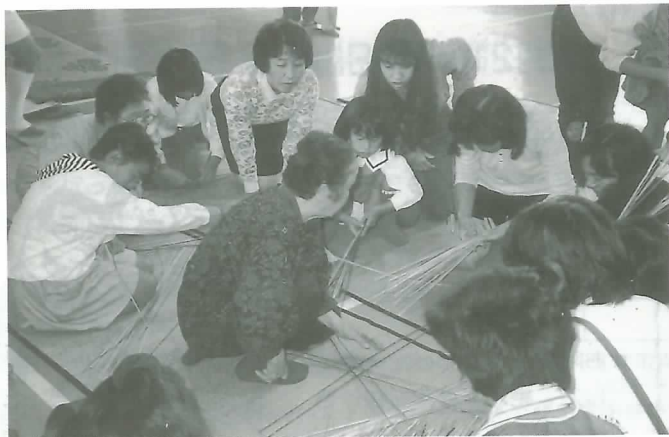
▲ 竹かごづくりに取り組む参加者

会場はしめ縄づくり、竹かごづくり、竹トンボづくりなど9つのコーナーに分けられ、それぞれの技能を持ったお年寄りが講師となって作り方を伝授。初めて習う父母も多く、親子が一緒になってお年寄りの技術に学びながら、作品づくりに一生懸命取り組んでいました。