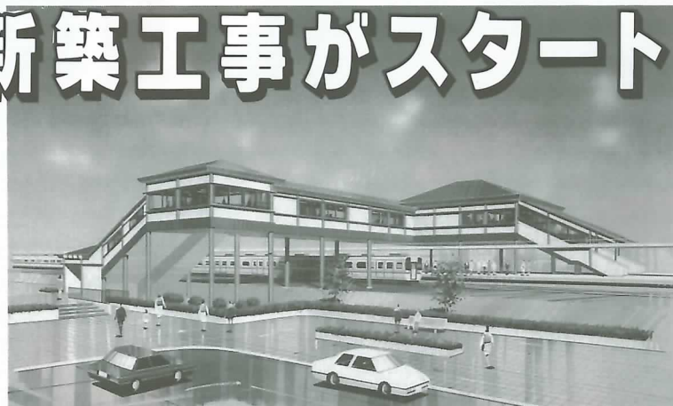
▲ 垂井駅橋上駅・自由通路完成予想図

JR垂井駅橋上駅本屋新築工事の起工式がこのほど行われました。駅舎の橋上化、自由通路橋の新設、駅前広場の整備など、町の新しい玄関口づくりに向けて、JR垂井駅周辺整備事業がいよいよ始まります。