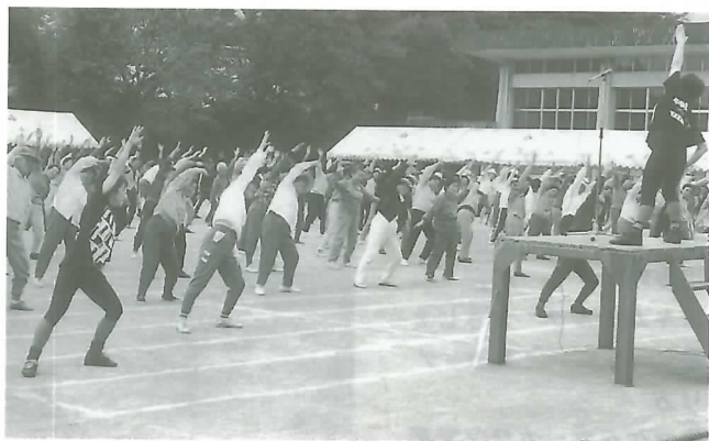
▲シルバーダンスで気持ちもスッキリ

第17回町老人体育大会が10月17日、垂井小グラウンドで約750人が参加して行われました。