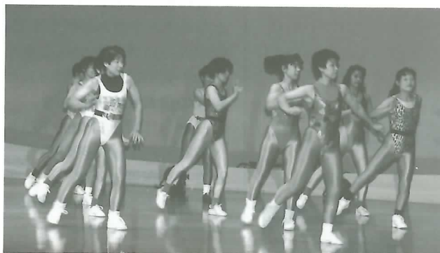
▲「アー・ユー・レディ・フォー・ミー」を披露する垂井ジャズダンスクラブの皆さん

主催者の町芸術文化協会には現在47団体、約2,500の方が所属しており、多彩な芸術文化活動を展開。芸能祭のほかに華道展や菊花展、盆栽展なども開催されます。