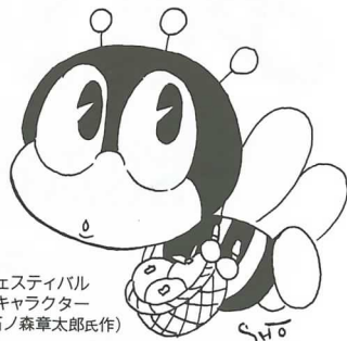
生涯学習フェスティバル マスコットキャラクター マナビイ(石ノ森章太郎氏作)