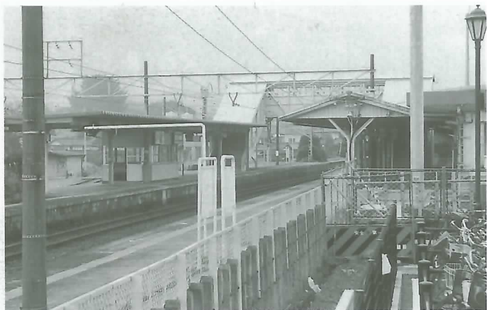
▲ 老朽化が進む現在の垂井駅

自由通路橋の上がり口2か所と、駅舎—ホーム間には、車いす対応のエスカレーターを設置します。また上りホームには専用通路を設けるなど、身体の不自由な方でも利用しやすい設計を心掛けています。