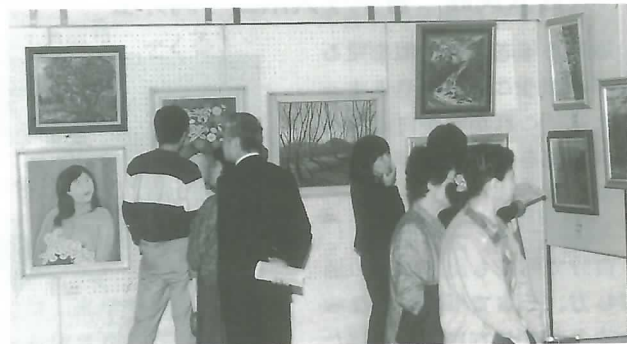
▲ 力作に見入る観賞者