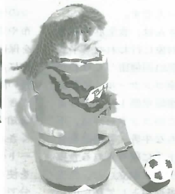
▼「アルシンドちょ金箱」