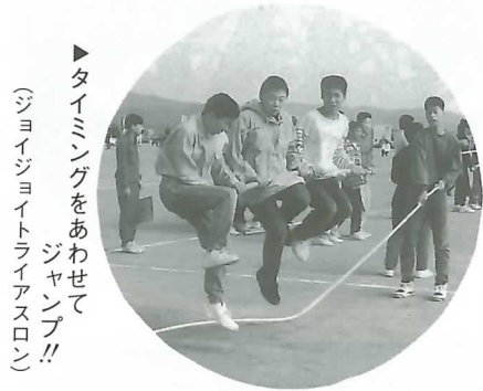
▶タイミングをあわせて ジャンプ!! (ジョイジョイトライアスロン)