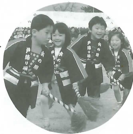
保育園児がリズム 演技などを披露 (チビッコアトラクション)

7日は晩秋の中山道を楽しみながら歩く「中山道・垂井宿史跡ウォーク'93」が開かれ、約1,100人が参加しました。午前10時から随時垂井駅をスタート。途中、美濃路松並木、追分道標、垂井の泉など史跡を楽しみながら、朝倉運動公園までの全長約8キロをマイペースで歩きました。歩き終えた人たちは、垂井ピア会場でイベントに参加するなど秋の一日を楽しみました。