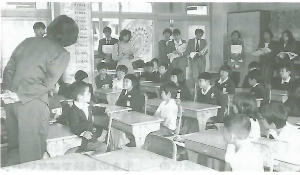
▶ 道徳教育の公開授業