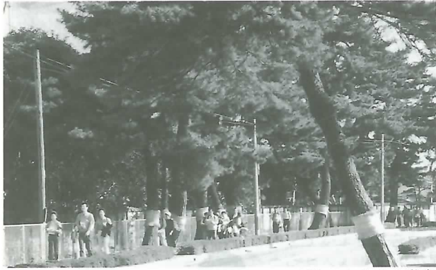
▲晩秋の中山道を満喫 (中山道・垂井宿史跡ウォーク'93)