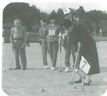
▲グラウンドゴルフ