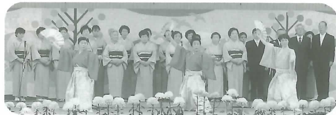
▲詩吟・剣詩舞のつどい