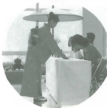
◀勤労青少年ホームの 講生によるお茶会