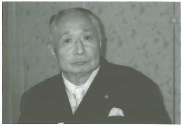
▲ 故 浅野元脩氏