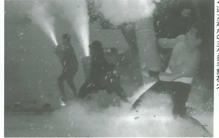
◀迫力満点の三ヶ日手筒花火