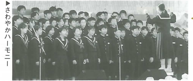
▶さわやかハーモニー