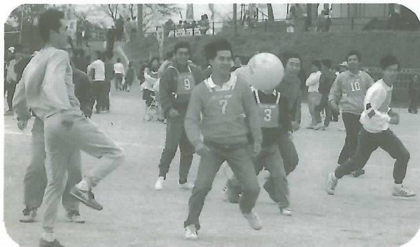
◀熱戦が繰り広げられた ラージボールサッカー