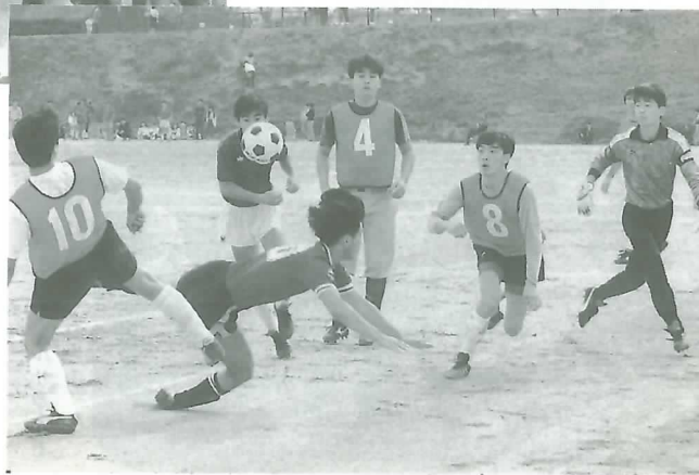
◀ふれあい交流サッカー大会