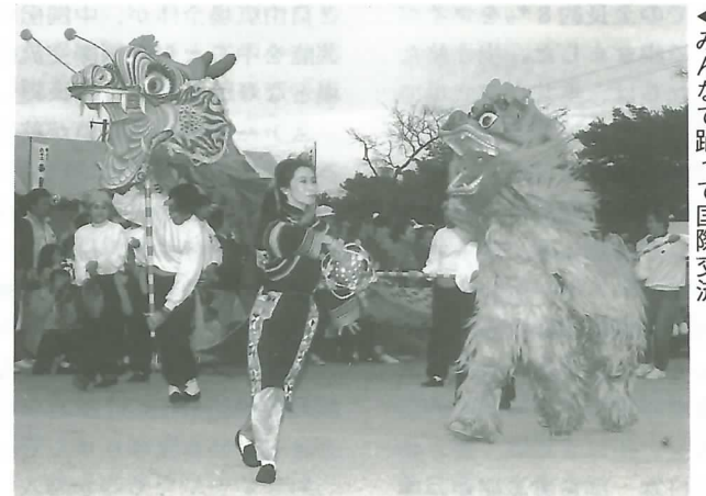
◀みんなで踊って国際交流