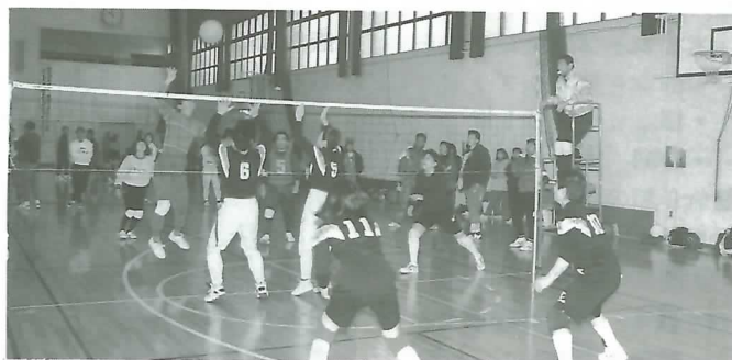
▲勝利に向かってアタック!!

ソフトバレーボール大会が2月27日、50チーム350人が参加して朝倉運動公園町民体育館で行われました。