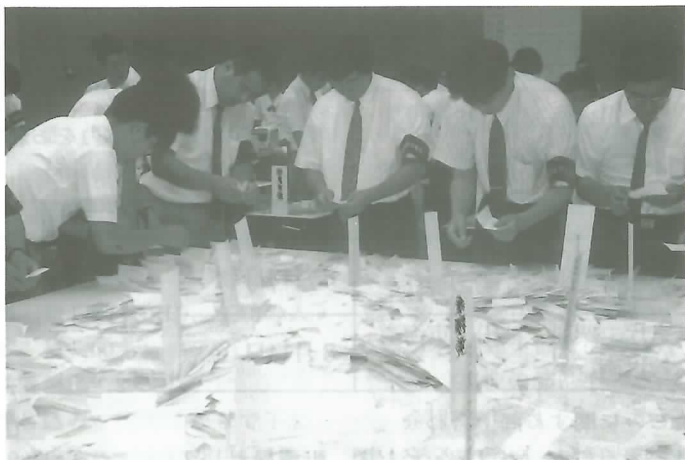
▲ 役場の大会議室での開票風景