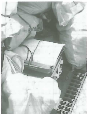
▲本などは廃品回収へ