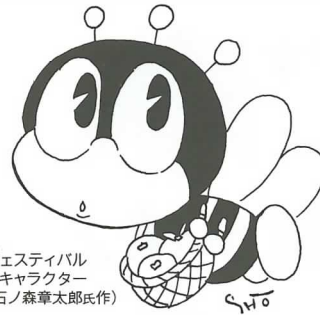
生涯学習フェスティバル マスコットキャラクター マナビイ(石ノ森章太郎氏作)