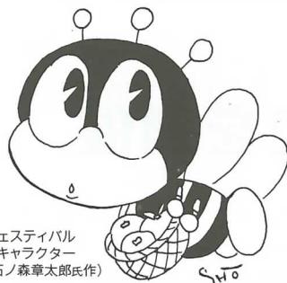
生涯学習フェスティバル マスコットキャラクター マナビイ(石ノ森章太郎氏作)

平成2年の文化祭では、長浜しゃぎり保存会との交流を実現させ、また、翌年には長浜サミットへ参加し、垂井町の存在をアピールしています。