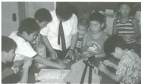
◀ 廃材を利用してひと工夫

まず、「困った探し、から始め、それをどう解決するかがポイント」など発明の手掛かりを