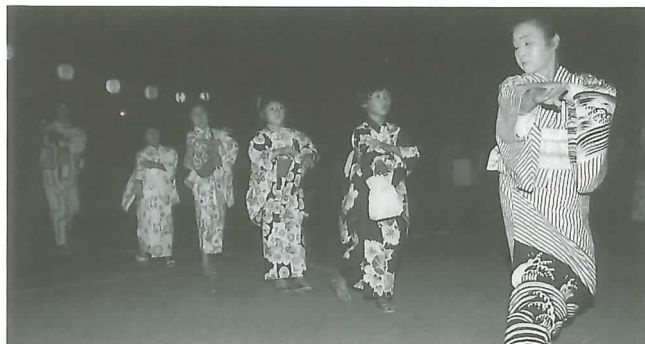
◀ 楽しく踊る子どもたち

盆おどり大会では、浴衣姿の子どもや親が踊りの輪を作り、夏の夕べのひとつきを楽しく過ごしました。