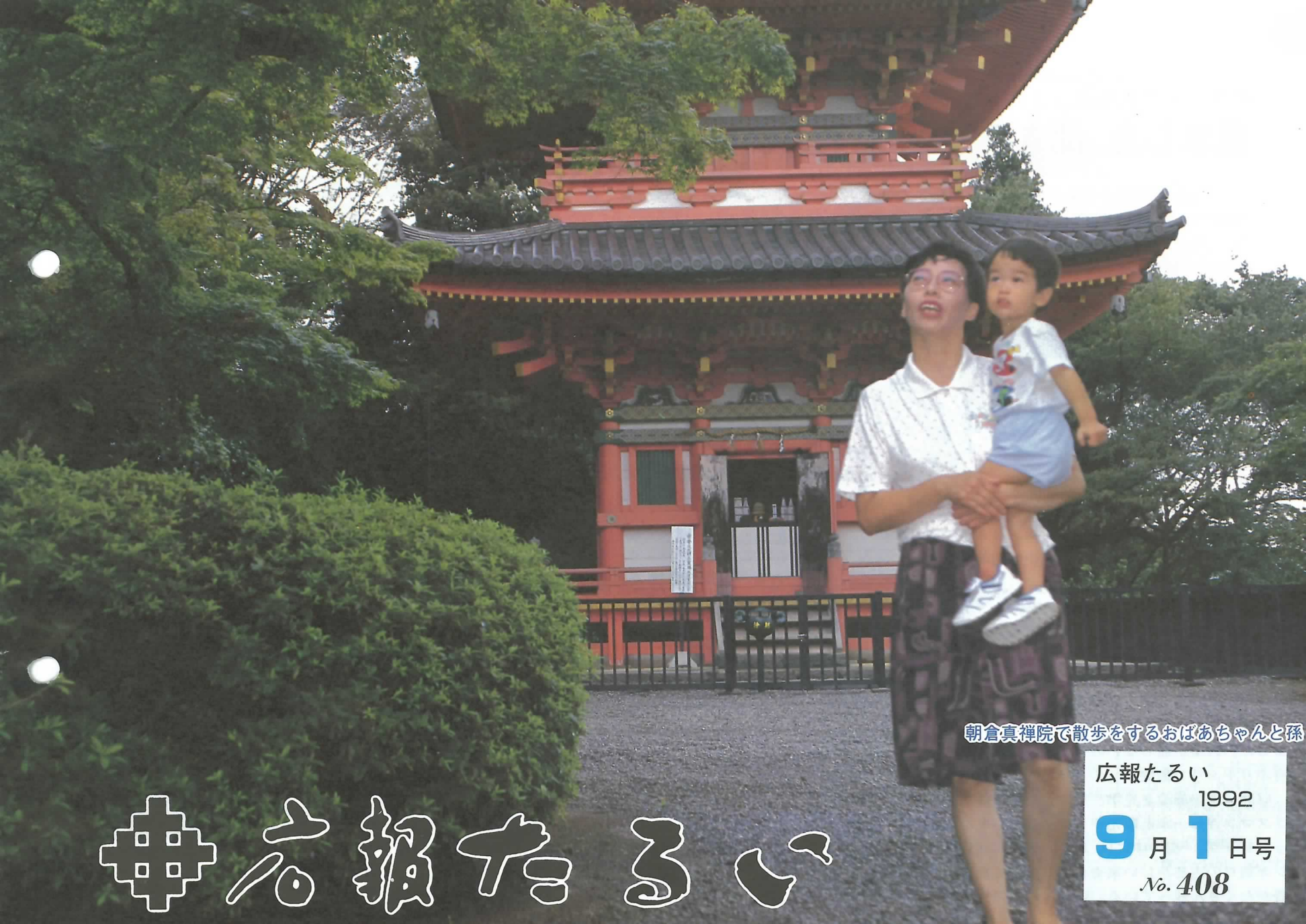
朝倉真禪院で散歩をするおばあちゃんと孫