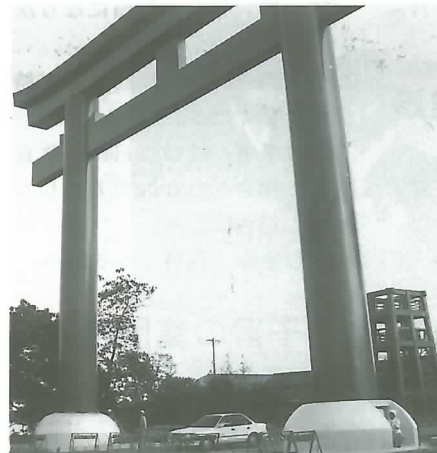
▲威容を現した大鳥居