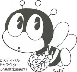
生涯学習フェスティバル マスコットキャラクター マナビイ(石ノ森章太郎氏作)