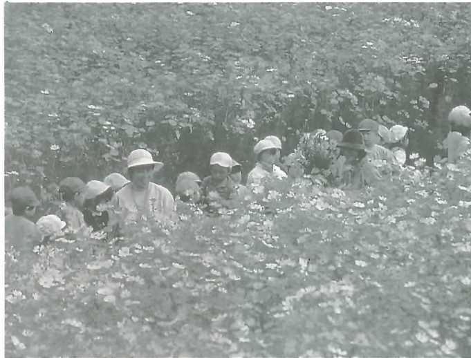
表佐小 コスモスの花を見に訪れた表佐保育園の園児

JR垂井駅南側や表佐地内の転作田にコスモスの花が一面に広がり、道行く人の目を楽しませています。