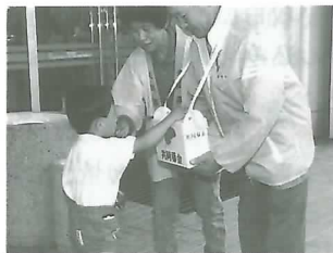
▲小さな善意が広がります

町社会福祉協議会では、10月末まで自治会を通じて募金活動を展開し、年末までに目標額2,182,000円達成を目指します。また、JR垂井駅、町役場、文化会館、中央公民館、社会福祉会館には募金箱を設置しています。