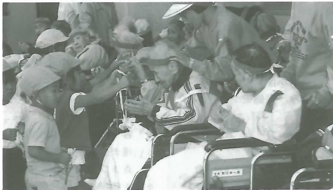
▲園児から手づくりの首飾りを掛けてもらう入苑者

披露したりパン食い競争に参加。手づくりの首飾りをお年寄りに掛けると涙ぐむ姿が見られました。