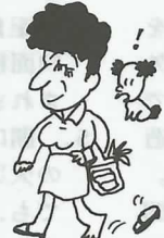
スリッパやサンダルの片ほうだけが脱げても気がつかない