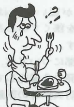
しゃべるとき舌がもつれたり、物がうまく飲みこめなかったりする