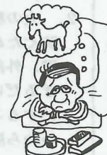
特別な理由もないのに寝つきが悪くなった