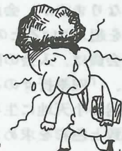
鈍い頭痛がつつく