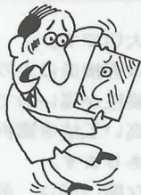
片ほうの目が急にかすみ、スースと治る