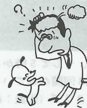
一瞬、意識がなくなる