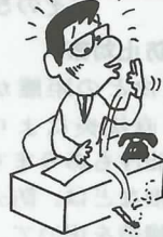
タバコや鉛筆をポロリと落とす