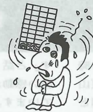
壁や障子がグルグル回ってしゃがんでしまう