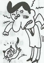
イライラがはげしく、すぐ腹を立てる