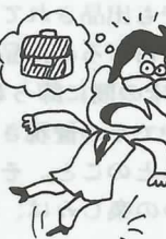
物忘れがひどくなる