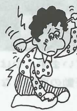
肩や首がひどくなる