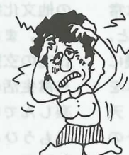
激しい頭痛がする