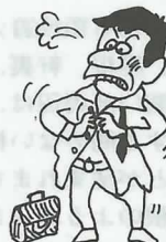
ワイシャツのボタンがうまくはめられない