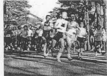
12月1日(日) 10:00 南宮大社弓道場