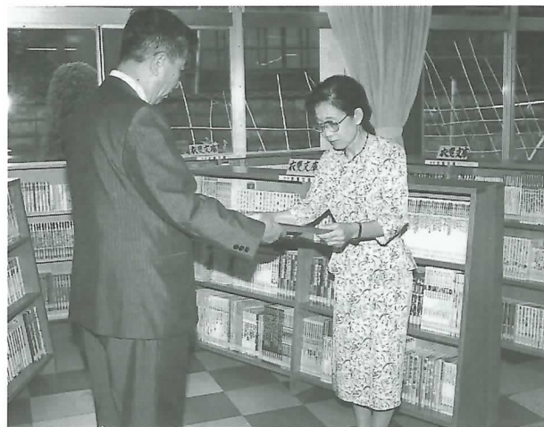
◀ 文庫には子どもたちが少しでも良い本に出会えよう願いが込められています

寄付を受けた町では町内の学校教諭9人に図書の選定を依頼し、児童図書を中心に1900冊を購入。童話、植物図鑑、小説、コンピューター関係書などバラエティーに富んだ内容となっています。