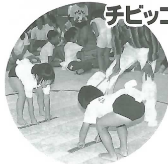
▲ 女の子も負けてはいません

開かれ、各自治会、老人クラブ、民生委員代表ら約500人が参加。会場にはボランティアの手話通訳者が立ち、障害者の大会参加を手伝いました。福祉に寄与された方に表彰状、感謝状を送った後、福祉協力校としてボランティア活動などに励んだ岩手小、合原小、不破中が成果を発表しました。