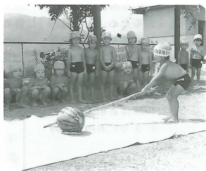
▲ なかなか割れません

きさのスイカ3個を用意。手ぬぐいで目隠しされ、竹を振りかぶって『エイヤァー』とたたいてもはじき返されなかなか割れません。最後は包丁で切ってもらいおいしそうに食べ楽しい1日となりました。