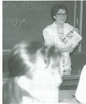
▲ 楽しく英会話講座

歳までの男女28人で、あいさつなど簡単な日常英会話を学んでいます。参加者が自分で決めた「ミッチ、モンロー、ジュリア」などの愛称で互いに呼び合い楽しく進められています。