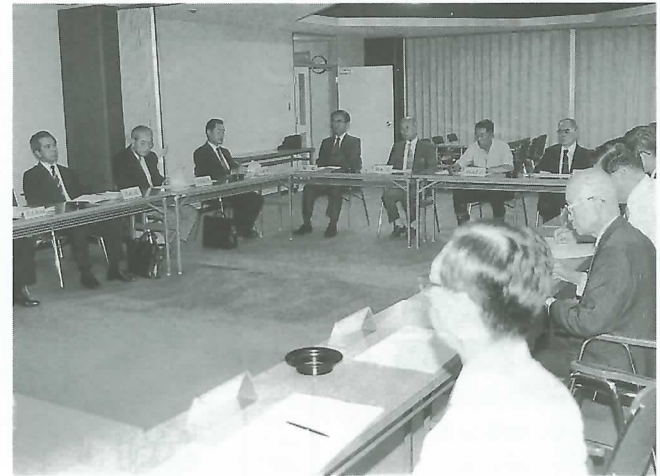
刊行委員会の初会議