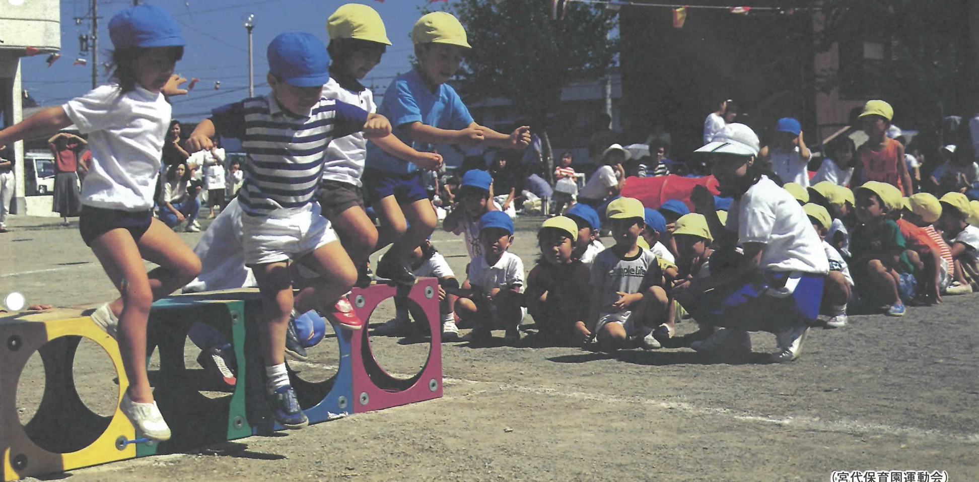
(宮代保育園運動会)