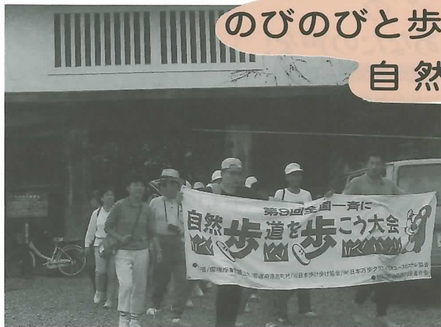
▲ やぐら門をくぐり元気に出発

恵まれた自然の中でのびのびと歩いて休日を満喫しようと9月24日、東海自然歩道歩け歩け大会が岩手地区で開かれ、約650名の参加者が約7キロのコースを元気に歩きました。