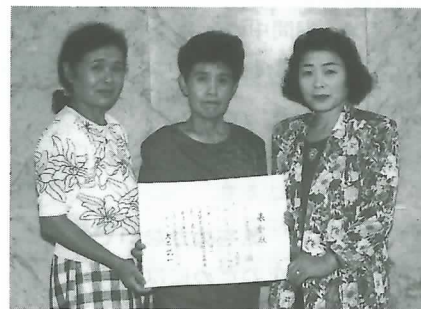
▲ 喜びの会員代表ら