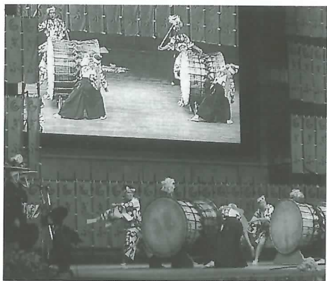
▲ メインホールに大きな太鼓がよく似合います

午後1時から始まった昼の部の郷土芸能ステージに当町の表佐太鼓踊りが登場。5つの大太鼓を打ち鳴らし、来場者を圧倒、さかなな拍手を浴びました。