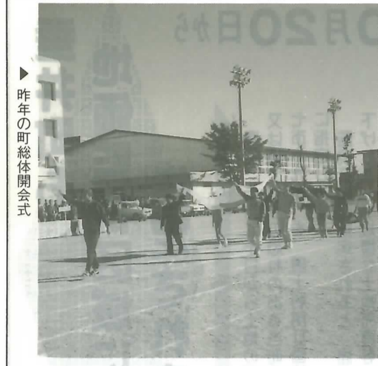
▶ 昨年の町総体開会式

○ 岩手公民館 22-1007 ○少年サッカー教室 11月4日(日) 12:00 朝倉野球場 ○町秋季バレーボール大会 11月11日(日) 9:00 表佐小体育館