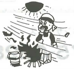
①風の強いときは、たき火をしない。

不破消防組合発表による平成二年火災・救急統計によると町の火災発生件数は十三件で、前年に比べて二件減少したものの損害額は七千二百三十三万円と、前年の五十七万九千円を大きく上回りました。これは建物の全焼が三棟、半焼が一棟あったためです。幸い死者はなく、けが人が一人だけにとどまりました。 出火原因はトッパがたき火の六件、以下こんろ、ガスバーナー、電気ストーブが各一件、その他四件と不注意によるものが多く発生しています。 冬から春先にかけてが、一年を通じて火災が最も多い時期です。この時期は空気が乾燥し、強風が続くなど、火災が発生しやすい条件がそろっています。それだけにちよっとした火への不注意が大きな火災につながります。