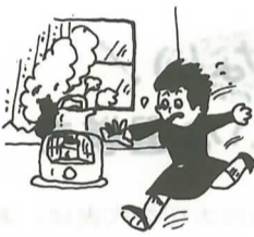
⑦ストーブには燃えやすいものを近づけない。