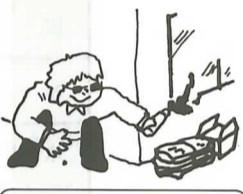
⑤家のまわりに燃えやすいものを置かない。