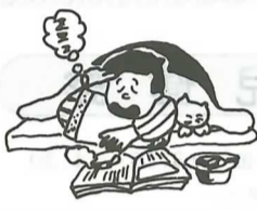
③寝たばこやたばこの投げ捨てはしない。