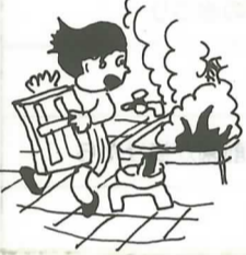
④ふろの空だきをしない。