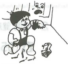
②子供は、マッチやライターで遊ばせない。