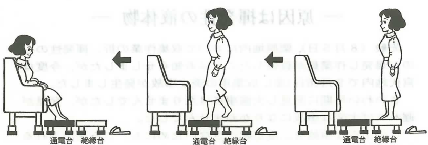
①履物をぬいで絶縁台に上がる。②通電台（黒い部分）に立つ。③ゆったりと椅子に腰かける。