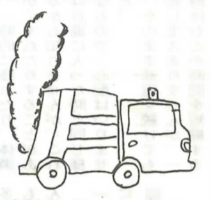
(厚生課☎②1151 内線239) 清掃センター☎②3789

編み物教室 9:00 講師：樋口科子先生 10月27日(木)から、冬の部として五回(木曜日)を予定)開講いたします。 一回目は編みぐるみ…きりんを作ります。二回目からは冬物にチャレンジ! あなたも、この冬は暖かい手編みのセーターで、ホッとな冬を…。