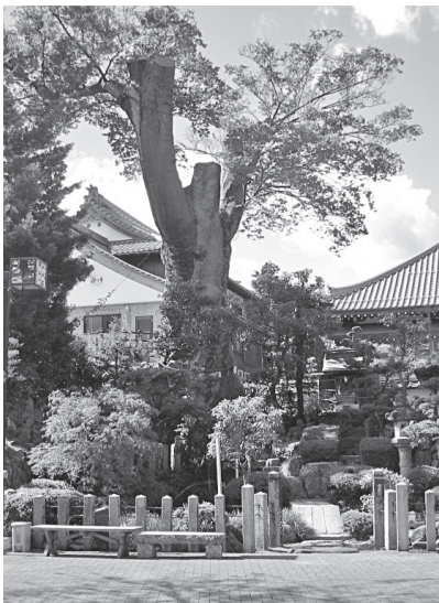
▲垂井の泉と大ケヤキ(平成20年頃)

大河ドラマ『鎌倉殿の13人』の主人公、北条義時の時代にあたる承久三年(一二二二)六月七日、承久の乱で東国の軍勢が野上・垂井両宿に陣を敷いたという『吾妻鏡』の記録が「垂井」という地名の最も古い記録です。平成二十七年に倒れた垂井の大ケヤキも樹齢八〇〇年といわれているので、この時代に植えられたものだったのでしょうか。