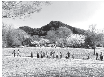
桜をバックに咲き誇る約8万株のネモフィラ

広さ約3,000㎡に約8万株のネモフィラが咲く「ネモフィラの丘」。小さく可憐なネモフィラが丘一面に咲く景色は絶景です。青い花の絨毯を歩いているかのような非日常の空間にぜひ癒されてみませんか。