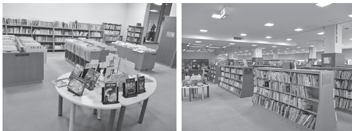
▲リニューアルした児童書コーナー

紙芝居、外国の小説や文庫本を移動、また小さなお子さんが使いやすいよう、絵本の棚や展示テーブルを増やし、全体的にゆとりのある空間に生まれ変わりました。ぜひご家族でお出かけください。