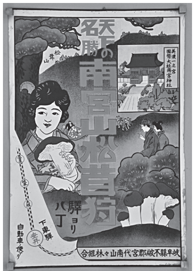
▲天下の名勝南宮山松茸狩ポスター

豊富な収穫量を誇った松茸も、今では伊勢湾台風を境にして、垂井町での収穫量は激減してしまいました。