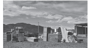
▲回収された粗大ごみ