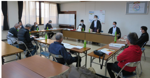
南宮大社初詣の交通規制会議 (11/28)

垂井町産業課主催の 観光ガイドマナー講座に、メンバー11名が受講しました。 (於いて: 垂井ホール)