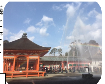
垂井町文化財防災訓練

今後もまちづくり協議会、そして消防団の一員として地域防災に取り組んでまいりますので、よろしくをお願いします。