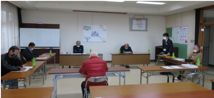
定例会(12/1)学校ボランティア活動について報告を受ける

社会福祉協議会より・垂井町社会福祉協議会について ・宮代地区ささあい連絡会活動についてを研修する。 【民生児童委員・福祉推進員・ちょっとサポーター 他 30名出席】