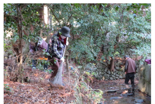
長寿会 南宮大社 清掃 (12/12)