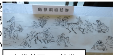
鳥獣戯画写し絵巻

者がインタビューを受け放映されました。見て頂いたでしょうか。今後も多くの方からの素晴らしい作品の