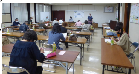
ささえあい連絡会・福祉推進員合同会議