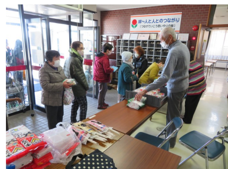
ふれあひサロンお便り通信(12/20)景品交換