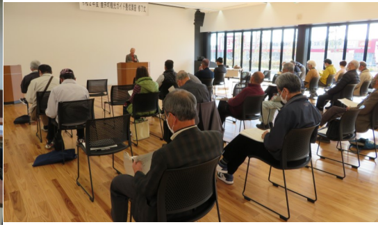
「宮代の自然と歴史・文化を愛する会」ガイドマナー講座受講(12/9)

垂井町産業課主催の 観光ガイドマナー講座に、メンバー11名が受講しました。 (於いて: 垂井ホール)