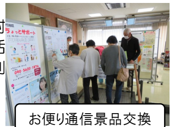
お便り通信景品交換

そして、ちょっとした困りごと、【ゴミ出し、草取り、話し相手など】、生活支援サポート「ちょっとサポート」はコロナウィルス感染対策を行い、気を付けて活動していますので、ご利用下さい。