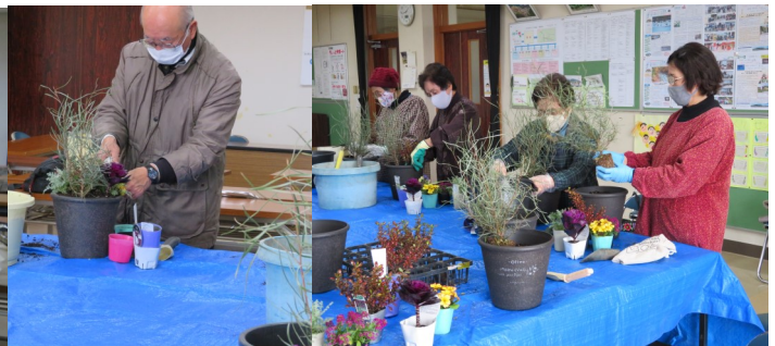
園芸寄せ植え教室 (12/19)