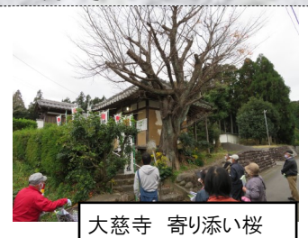
大慈寺 寄り添い桜

昨年11月に行われた「まちセン歴史講座」に参加し、『我が人生70年有余生きてきて、今まで知らなかったことの発見が沢山あり感動しました。』みなさんも家の中ばかりではなく、いろいろな行事に参加して、体を動かし頭を使い、お互い健康で長生きしようではありませんか。