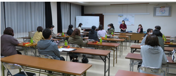
不破中PTA地区委員会 (12/13)