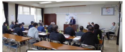
まちづくり協議会総会

祭り・運動会(ふれあいスポーツ)・文化祭は、皆さんの協力により開催したいと考えています。皆様のご協力・ご理解をお願いします。最後に皆さまのご健康を願って新年のごあいさつとします。