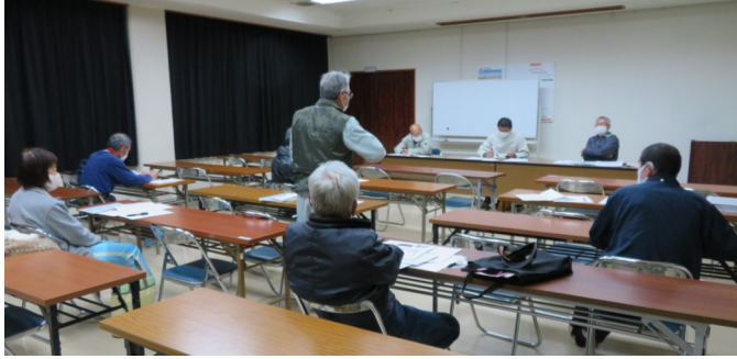
「宮代の自然と歴史・文化を愛する会」(11/25)