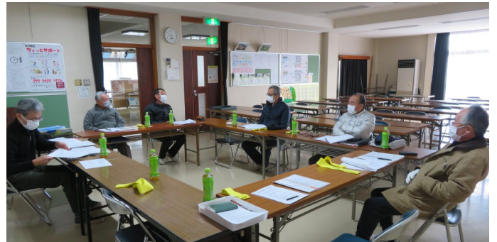
連合自治会役員会 (12/19)