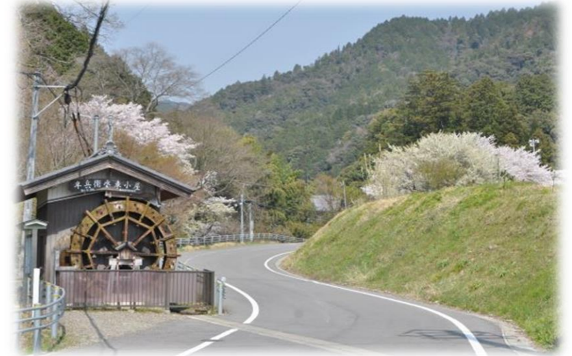
水車小屋（岩手川の水を利用して蕎麦を粉に）