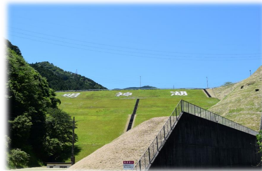
明神湖堰堤（垂井町北部の水がめ）