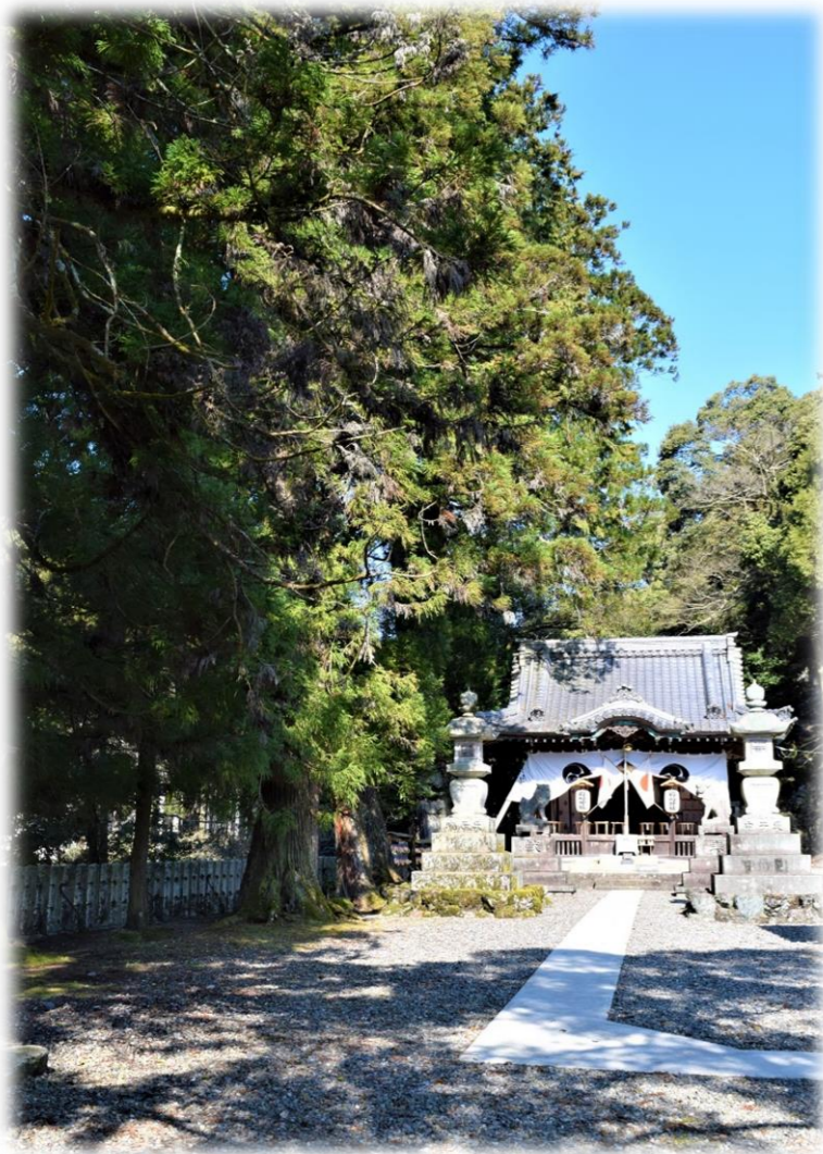
岩崎神社・杉の木を伐採する前と後