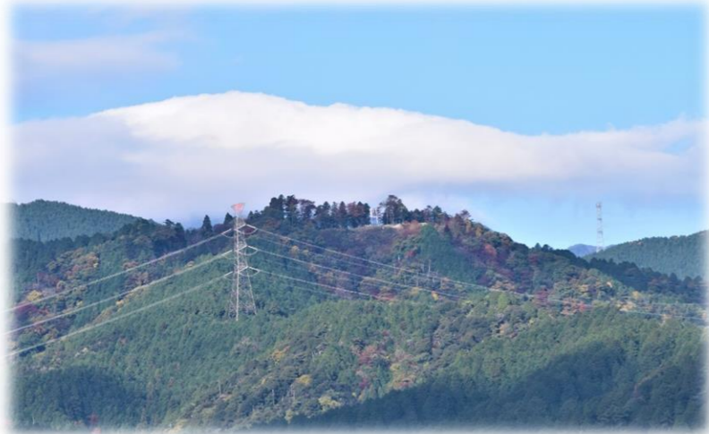
菩提山城跡遠望 2 景