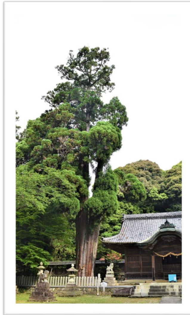
伊富岐神社大杉（岐阜県天然記念物）