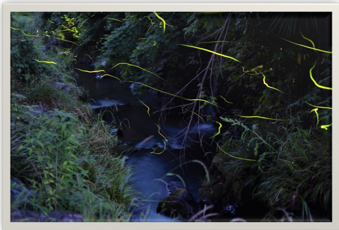
岩手川のホタル3景