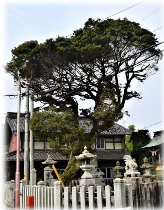
秋葉神社のヤマモモ