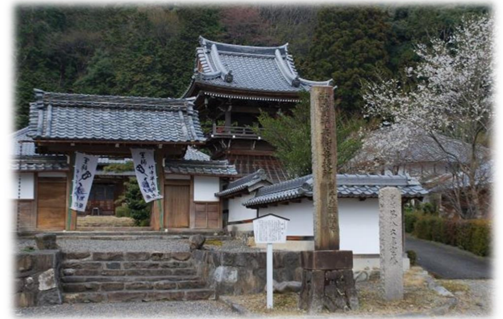
禅幢寺（竹中半兵衛菩提寺）