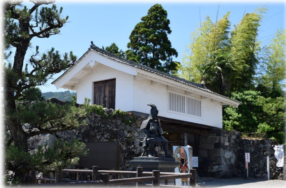
竹中氏陣屋跡（櫓門）