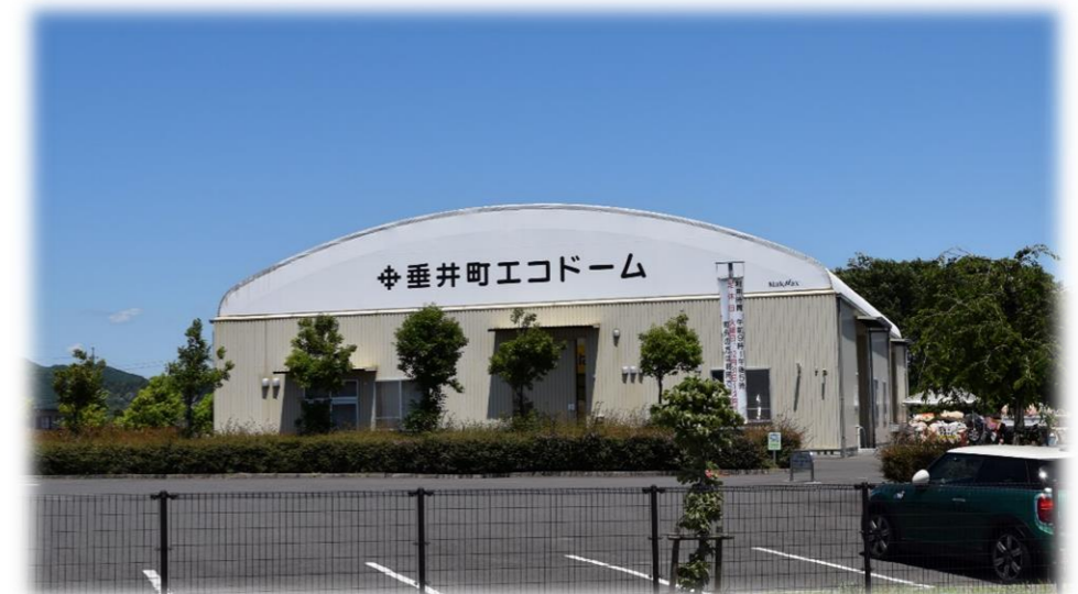
エコドーム（垂井町のリサイクルの拠点）