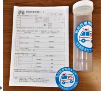
救急医療情報キット▶