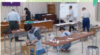
▲レーザークラフト