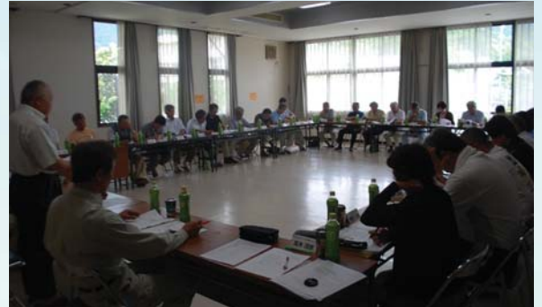
▲まちづくり協議会 運営委員会