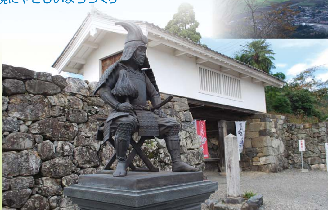
◀竹中半兵衛重治公の銅像と櫓門