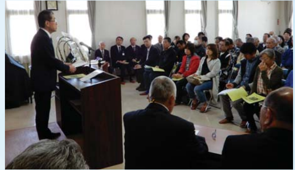
▲まちづくり協議会 総会