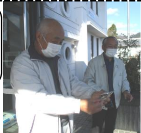
まちづくりセンター の皆さんいつもあり がとうございます。

勤労感謝の日にちなみ、地域で働く方、園の生活にかかわって働く方に、感謝の気持ちを込めた手作りのプレゼントを、お一人お一人に渡しました。たくさんの方がかかわっていることを知り、今日は誰に渡すのかな、とわくわくしている子どもたちでした。