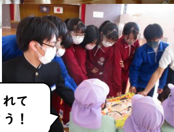
遊んでくれて ありがとう！