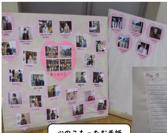
心のこもったお手紙 をいただきました。