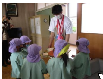
銀メダルおめでとうございます。