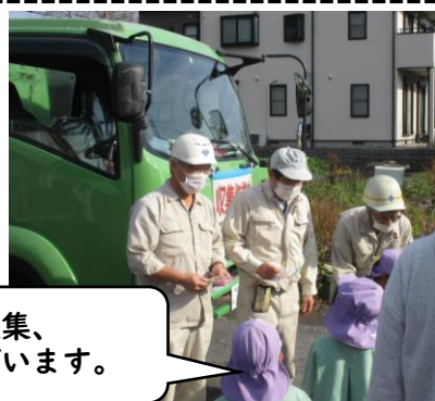
いつもゴミの収集、 ありがとうございます。