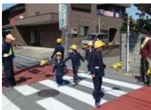
安全見守り (登下校)