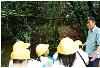
自然観察(モリアオガエル)