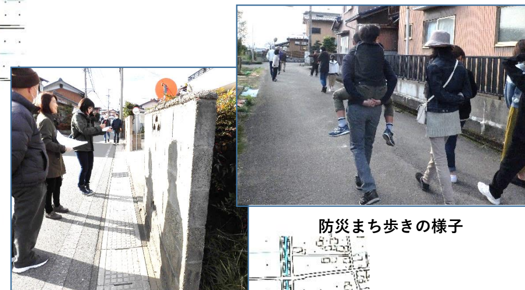
防災まち歩きの様子