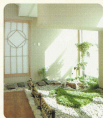
ガーデンスペース