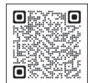
▲あいきクラブホームページ