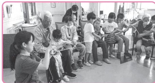
▲岩手子ども園と交流