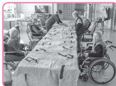
◀相川のこいのぼり作成