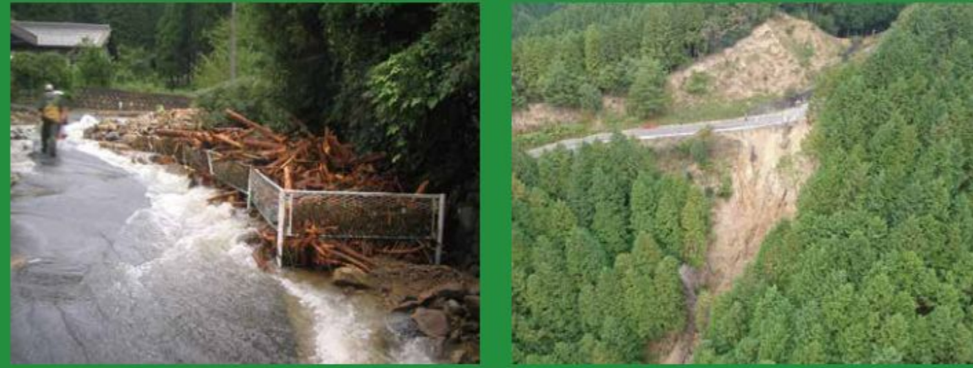
垂井町梅谷地内 平成20年 (台風被害)