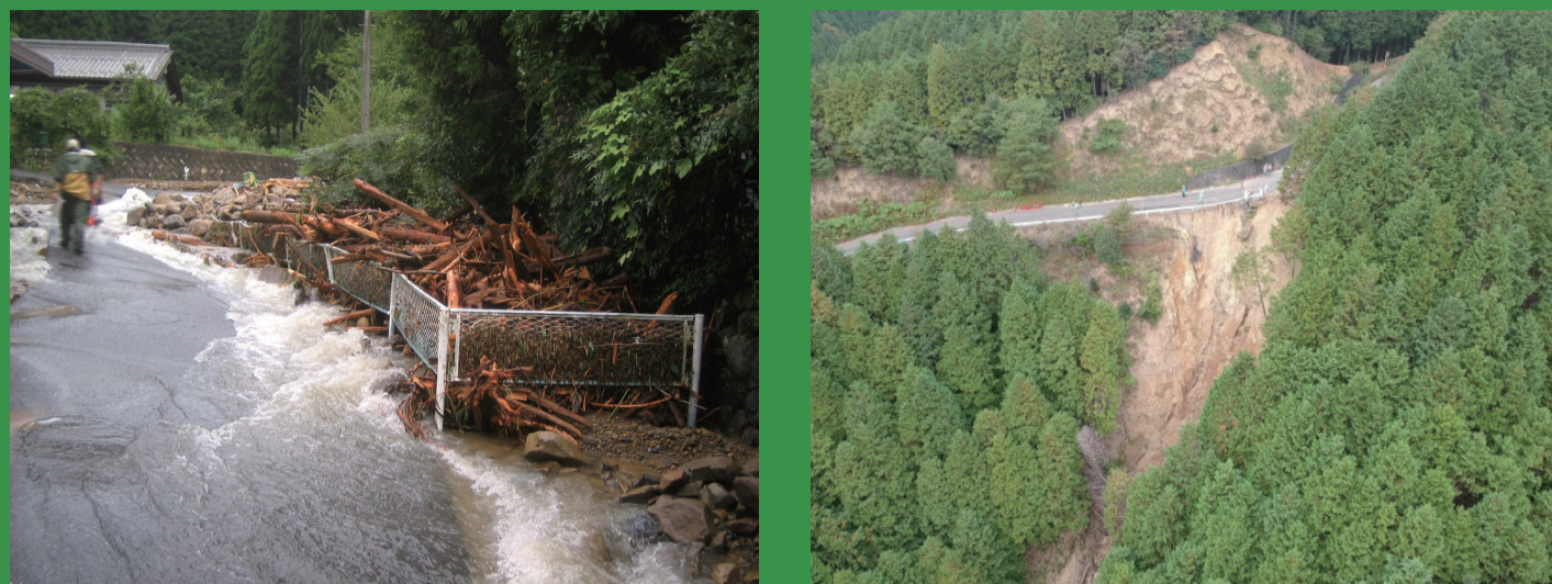
垂井町梅谷地内 平成20年 (台風被害)