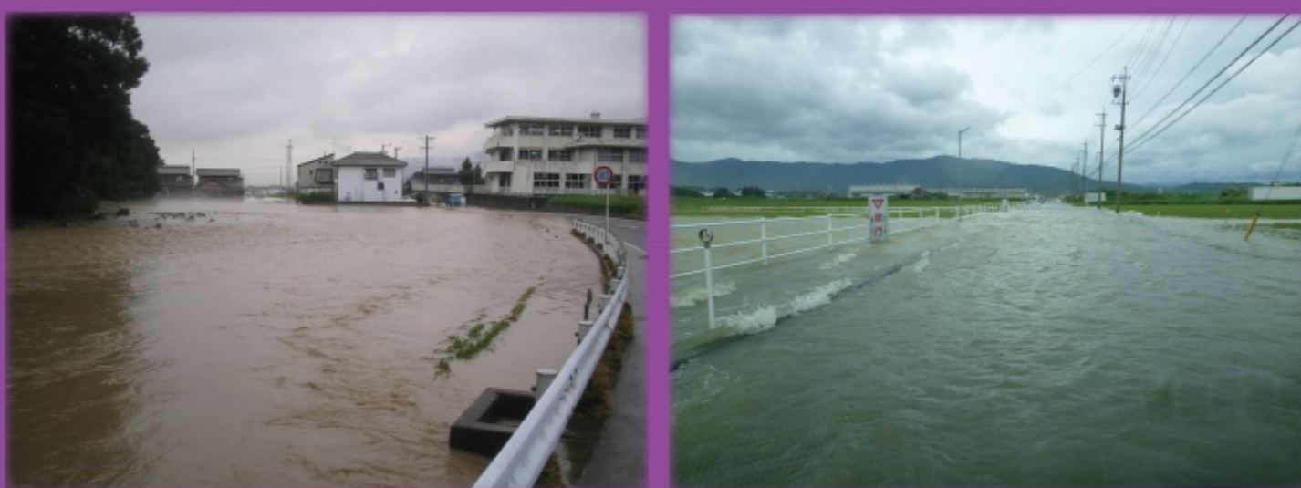
垂井町府中地区内 平成 20年 9月 2日 (ゲリラ豪雨による梅谷川氾濫) 垂井町栗原地区内 平成 25年 9月 15日 (台風 18号)

このマップは、垂井町内を流れる主要河川、および牧田川が大雨によって増水し、堤防が決壊した場合の浸水予想結果に基づいて、住民のみなさんの避難に役立つように、浸水の範囲とその深さ、ならびに避難場所などを示したものです。洪水が発生するおそれがあるときは、役場から避難情報が出されますので、このマップを持ってすみやかに避難してください。また、大雨の時には、雨の降り方や家のまわりの浸水状況に注意し、危険を感じたら早めの避難を心がけましょう。