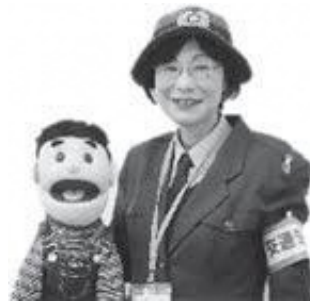
岐阜県の自転車関連事故(令和6年)

青切符の対象でもありますよ。絶対にやめましょうね！そして大事なこと、交差点では信号と一時停止を守って安全確認してくださいね。明日も笑顔で無事に帰宅しましょう！