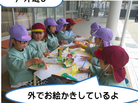
外でお絵かきしているよ