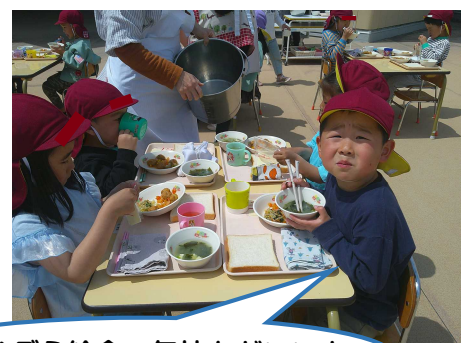
あおぞら給食、気持ちがいいよ

新しいクラスでの生活が始まりました。戸外では、固定遊具で遊んだり、砂場で遊んだりしています。外で遊ぶと気持ちも晴れやかになり「ママがいいー！」と泣いていた子の涙もピタリと止まります。