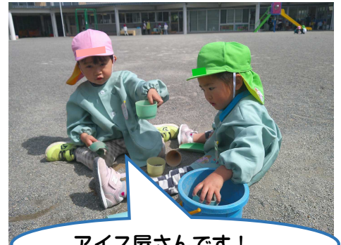
アイス屋さんです！