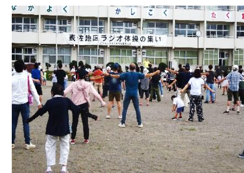
ラジオ体操のつどい+1