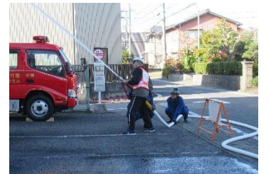
表佐地区防災訓練