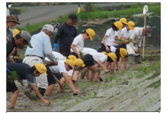
表佐小児童の田植え体験