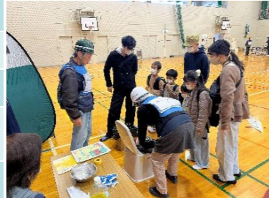
避難所体験スタンプラリー