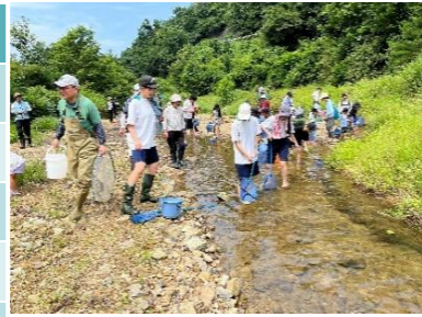
生物と触れ合おう in 自然体験学習の里