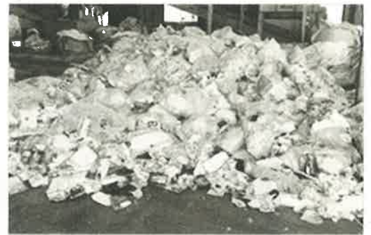
上の写真で1トン程度

初回の4月13日(月)と14日(火)の2日間で、4.3トンもの収集量があり、予想を上回る量でした。