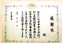
厚生労働大臣感謝状

※分納の場合は、初回寄付の前に、予め分納のご意志をお伝えいただく必要があります。