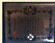
銀色有功章 (個人・法人)