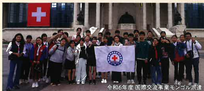
令和6年度 国際交流事業モンゴル派遣