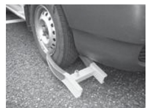
▲自転車差押の様子

自動車を写真のように差し押さえ、使用できない状態にします。指定する納期限までに納付しない場合は公売を行い滞納金に充てる場合があります。