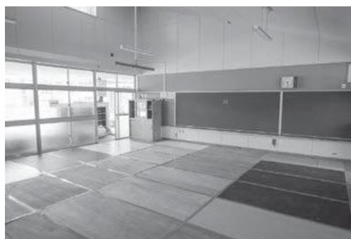
▲旧府中幼稚園 園舎内(4月8日現在)