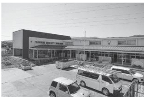
▲工事現場 外観(4月8日現在)

今後は、令和9年4月の供用開始に向けて工事を進めます。工事期間中は、周辺のみなさんにご不便やご迷惑をおかけする場合がありますが、安全確保に十分配慮しながら進めてまいりますので、ご理解とご協力をお願いします。