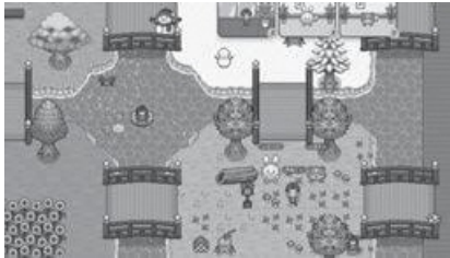
▲仮想空間のイメージ図

アバター（分身のキャラクター）で参加するため、顔出しは不要です。仮想空間の中で、同じ時間を過ごしたり、チャットや音声で交流することができます。交流日には、市町の動画配信や各種案内のほか、クイズや座談会などのイベントも開催します。「話すのは少し不安」という人は、空間にいるだけの参加も大歓迎です。また、相談日には保健師や社会福祉士などに、チャットや音声で相談することもできます。ご自身のペースで、安心してご参加ください。